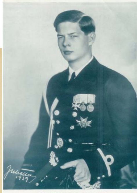
REGIA CA LADELE UNIFORME LIMAI DE ALBA IULIA